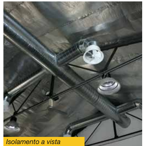
Isolamento a vista